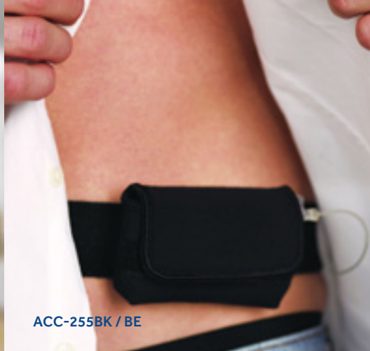
ACC-255BK / BE