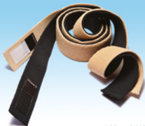
ACC-258BK / BE