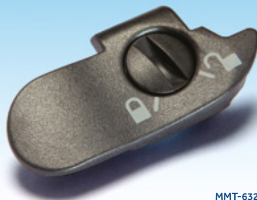
MMT-632 / 641