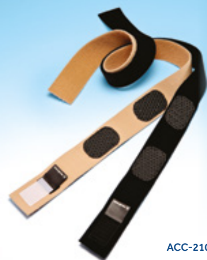
ACC-210BK / BE